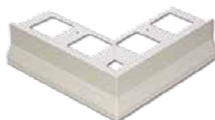
BHSE - A22