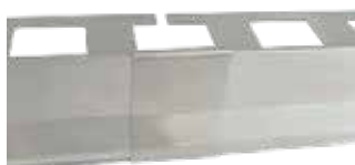
BHSG - A22